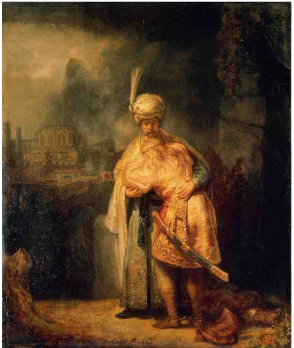
Rembrandt Harmensz. van Rijn (1606 – 1669), Davids afscheid van Jonathan

In de Bijbel wordt op een andere wijze gesproken over vriendschap. Abraham wordt Gods vriend genoemd en Israël Gods oogappel. Ook David en Jonatan worden vrienden genoemd. Een vriendschap van bijzondere aard. Bijzonder om wat het was, maar ook vanwege het unieke karakter ervan. Nergens in de Bijbel wordt zo liefdevol gesproken over een vriendschap tussen twee mensen, als over die tussen David en Jonatan. Het is een zielsverwantschap die gekenmerkt wordt door een aantal karakteristieken: