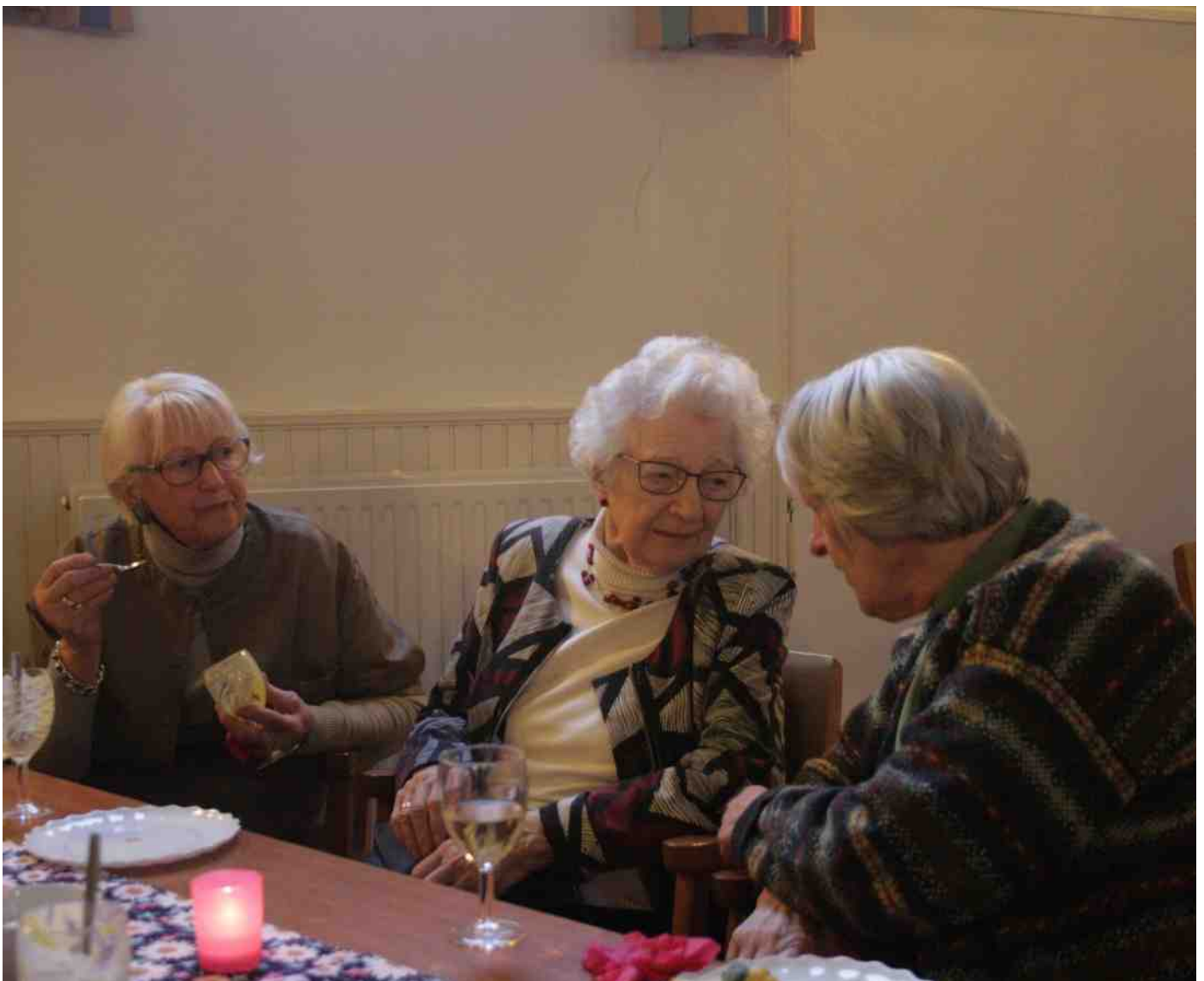
'Kerkvrienden' tijdens de high tea