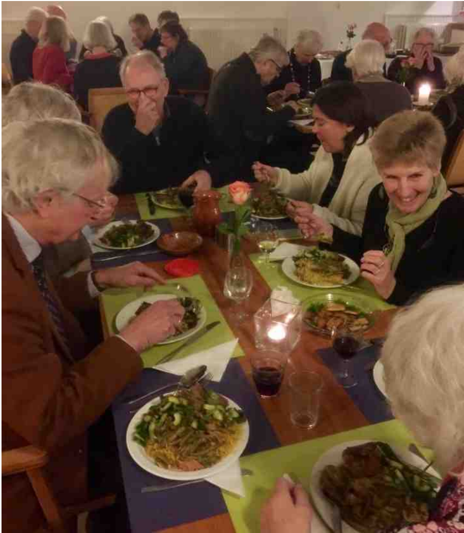
De eerste maaltijdgroep in de DZK op 4 februari is geslaagd!