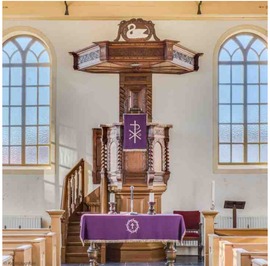
Lutherse kerk te Winschoten