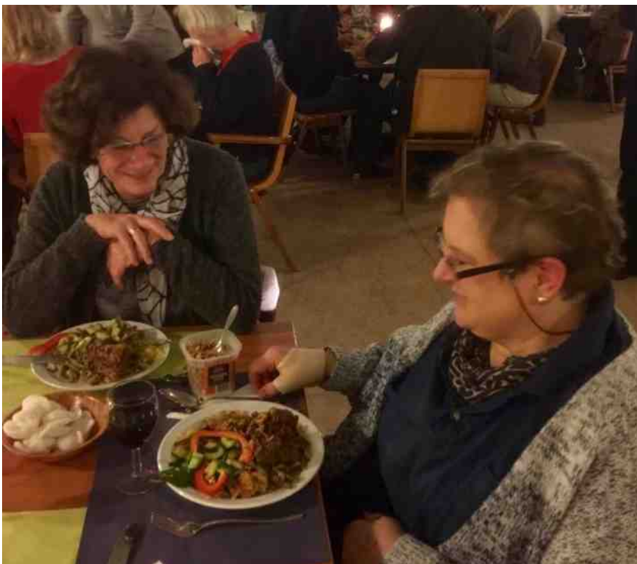
De tafels zijn mooi gedekt.