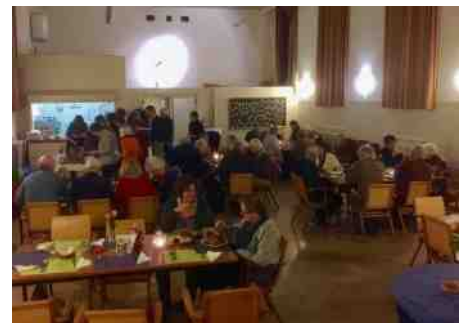
Het is een heel gezellig samenzijn met de mensen van de 'oude' maaltijdgroep en de mensen van de Duinzichtkerk.